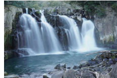
関之尾滝（せきのおのたき） ↓ 甕穴群（おうけつぐん） 穴に見えるけど、実はボコボコした1枚の岩。大きき世界一。

4月末の大型連休のタイミングで、都市部に大型キャンプ場がオープンしました。超有名企業の直営店で、その施設のエリア内には関之尾公園があり関之尾滝と甕穴群が目の前ということで、全国的なニュースにもなりました。